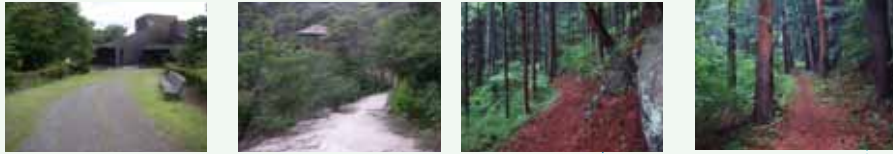
森林学習展示館 ゴール付近